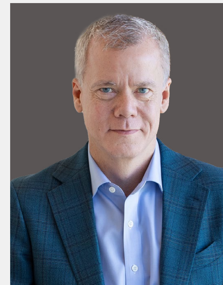
Chris Boerner, PhD Chief Executive Officer

우리의 정직의 원칙에 헌신하고, 우리의 가치를 실천하며, 항상 환자를 위해 올바른 결정을 내려주셔서 감사합니다.