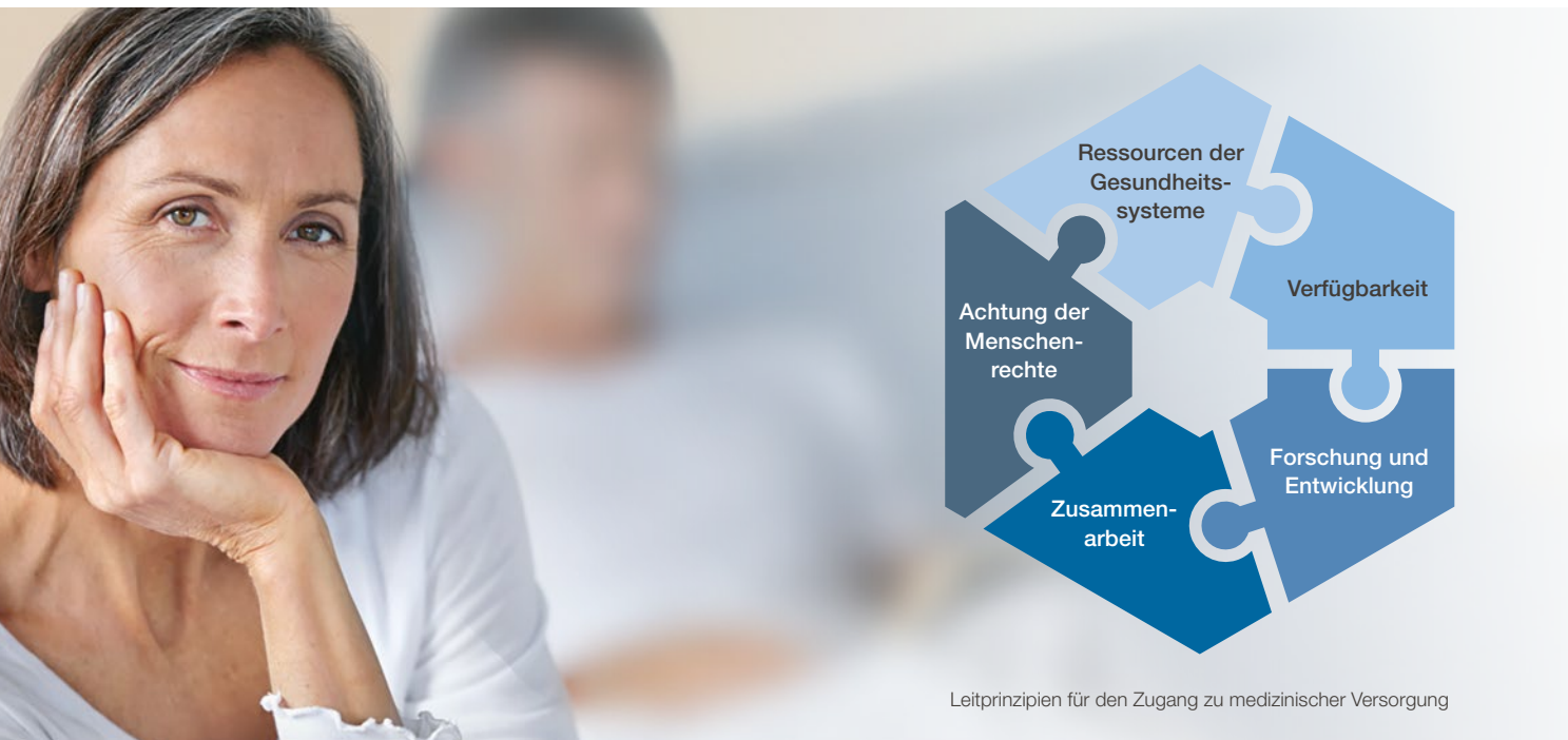
Leitprinzipien für den Zugang zu medizinischer Versorgung

Diese fünf Leitprinzipien spiegeln unter anderem unser Bestreben wider, klinische Studien transparent zu gestalten. Sie verdeutlichen den Stellenwert, den wir dem Aufbau lokaler Forschungs- und Entwicklungskapazitäten einräumen. Sie zeigen auch unser Bemühen um angemessene Preisstrategien, die den Wert von Innovation anerkennen und gleichzeitig Barrieren zum Zugang von Arzneimitteln abbauen sollen.