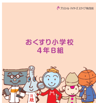
コーポレート・ブランドの変更に伴い 全体のデザインを一新

今回新たに追加したコンテンツは、服用した薬やその時の身体の様子などを書き込める「おくすり日記」と、登場するキャラクターをあしらった間違い探しです。さらに、冊子版では登場するキャラクターのシールも新たに用意し一段と楽しめる内容となっています。加えて本冊子の設置先も拡充します。これまでの「くすりの部屋ークスリウム」での無償配布ほか、新たに東京都千代田区の6児童館にも設置し、館内で閲覧できるようにします。デジタル版は引き続き当社ウェブサイトからダウンロード可能です。