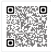
可心歐膠囊 5 毫克